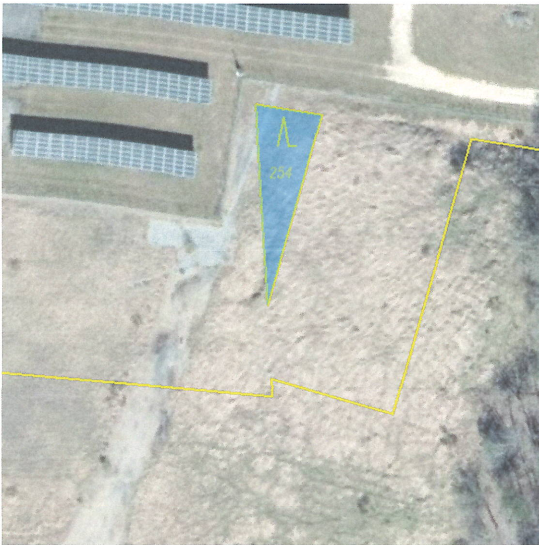
p. č. 254 lesní pozemek, k. ú. Kuřívody – 127 m 2