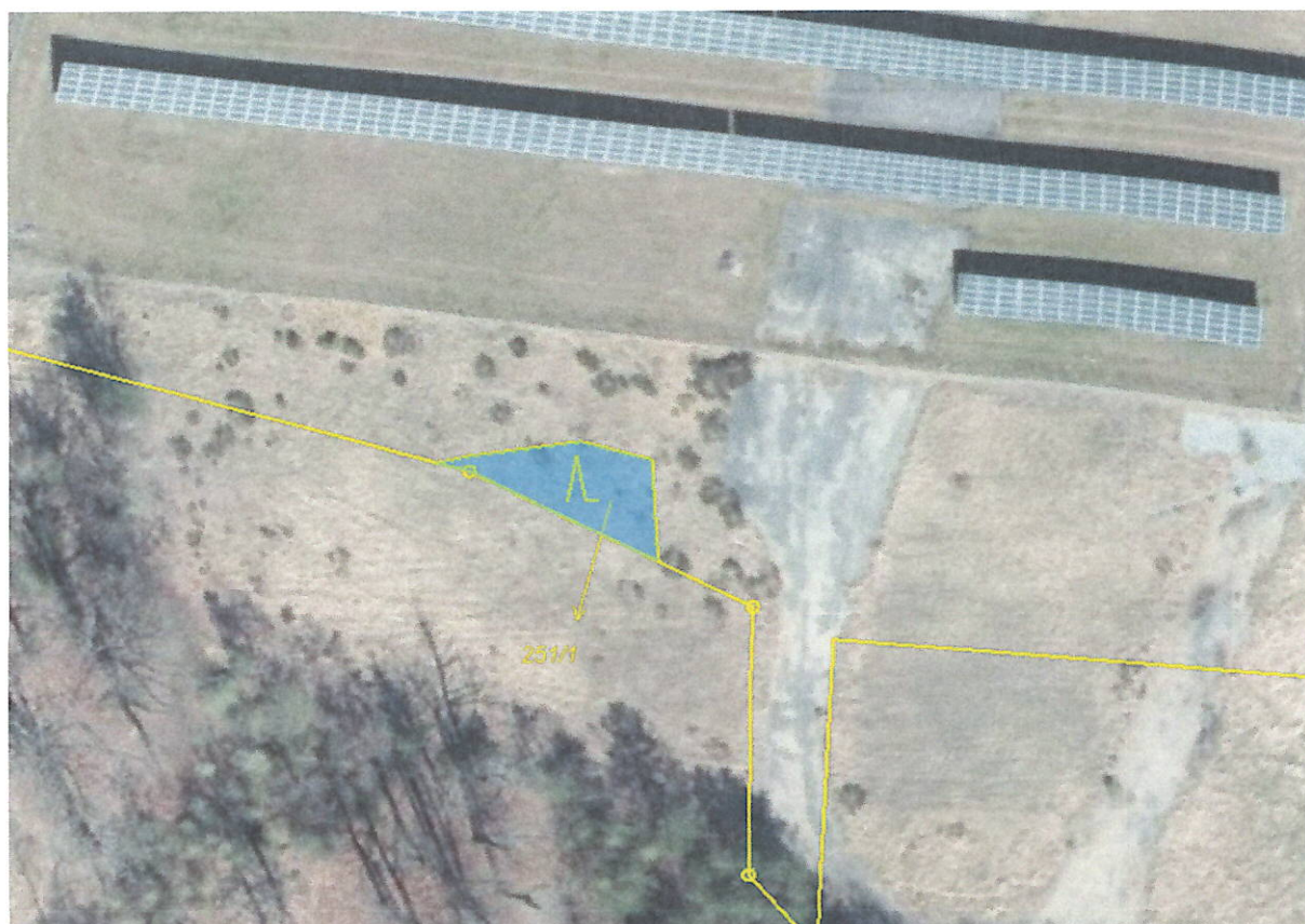
p. č. 251/1 lesní pozemek, k. ú. Kuřívody – 95 m 2