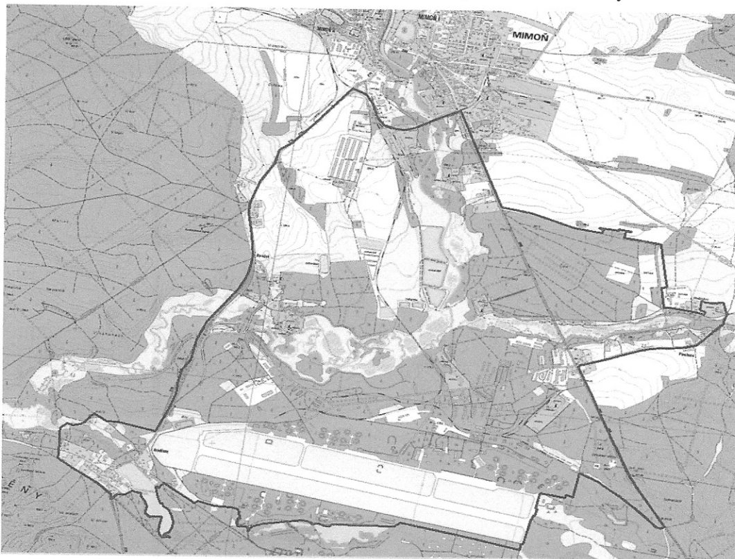
Obrázek č. 1: Vyznačení hranice navrhované honitby Ralsko Hradčany