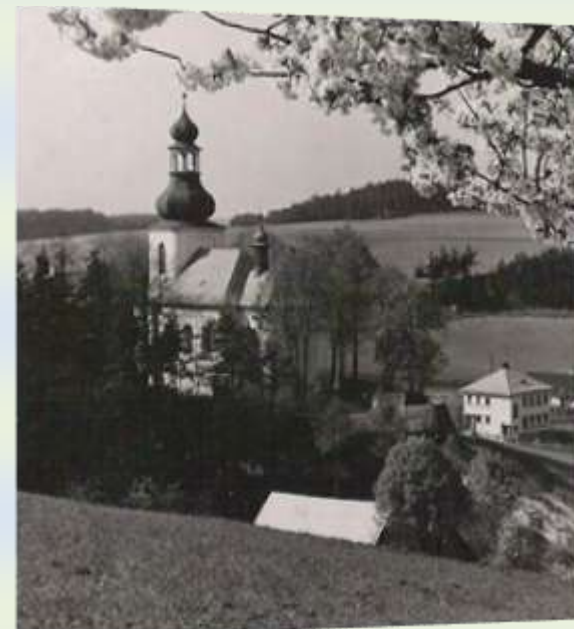
Foto z roku 1939 zachycuje novou školu v plné kráse.

Není bez zajímavosti, že v roce 1933 zde byla postavena Česká škola, kterou navštěvovaly i děti z některých německých rodin. Malá školička se zachovala dodnes stejně jako škola německá, i když jsou ve značně zdemolovaném stavu.