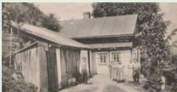
Obchod Franze Thierla na Chlumu.

Chlum měl podle sčítání z roku 1921 15 domů a 52 obyvatel. 51 z nich bylo národnosti Německé a jeden Čech. Co se týče povolání obyvatel osady Chlum, bylo zde 9 sedláků a pěstitelů zeleniny, 2 řemeslníci, 1 hospodský a 2 dělníci. (údaje ze Všeobecného sčítání v roce 1931). Jen pro orientaci. Okolní lesy v této době ještě neexistovaly.