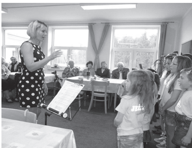
Vystoupení dětského sboru pro seniory v klubovně na Ploužnici