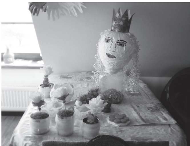
Výstava dětí výtvarného kroužku