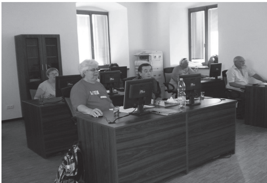
PC kurz - senioři