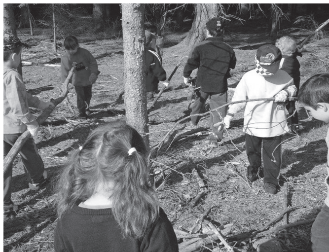
Úklid na Skelné Huti