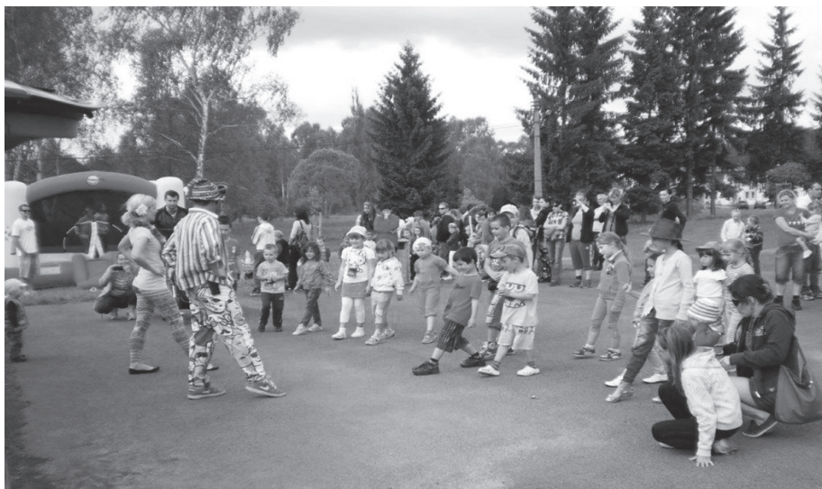
Dětský den v Kuřívodech

O pohodovou náladu po celou dobu se postaral Cucino s kouzelnou diskotékou, plnou zajímavých soutěží, her, hudby a hlavně tance. Pobavil nejen děti, ale i dospělé. Pro všechny přítomné byly k dispozici stánky s cukrovinkami a hračkami pro děti. Ten, kdo se Dětského dne zúčastnil, určitě nelitoval a my děkujeme všem, co se podíleli na přípravě letošního Dětského dne.