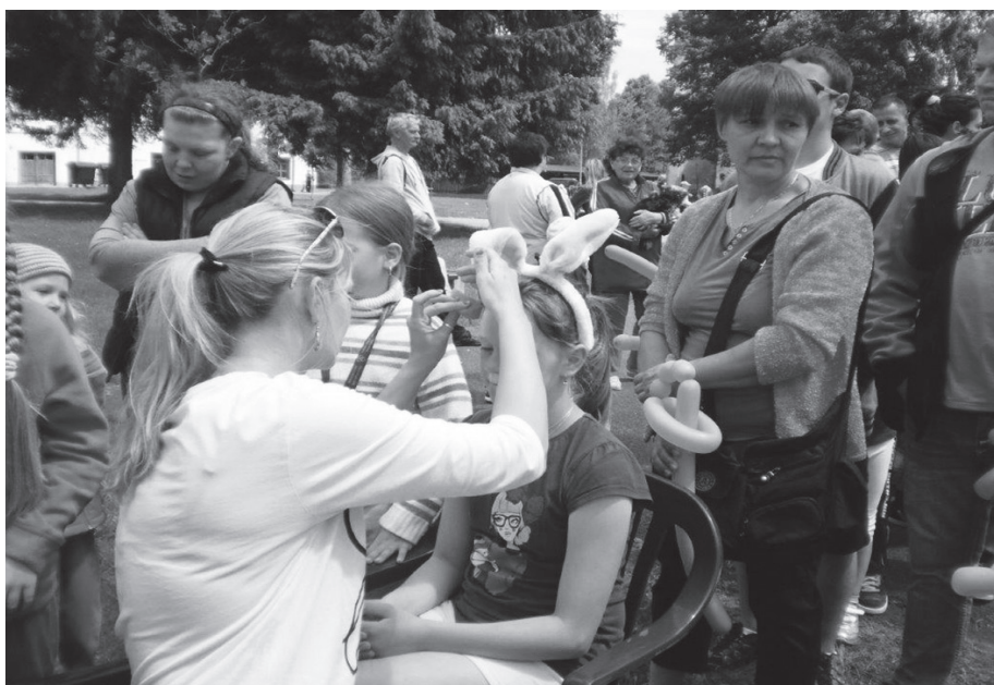
Malování na obličeji - Dětský den