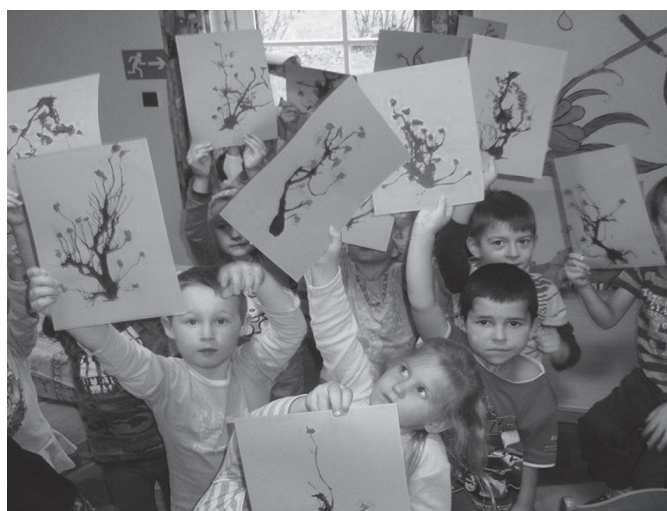
Výtvarné práce našich nejmenších