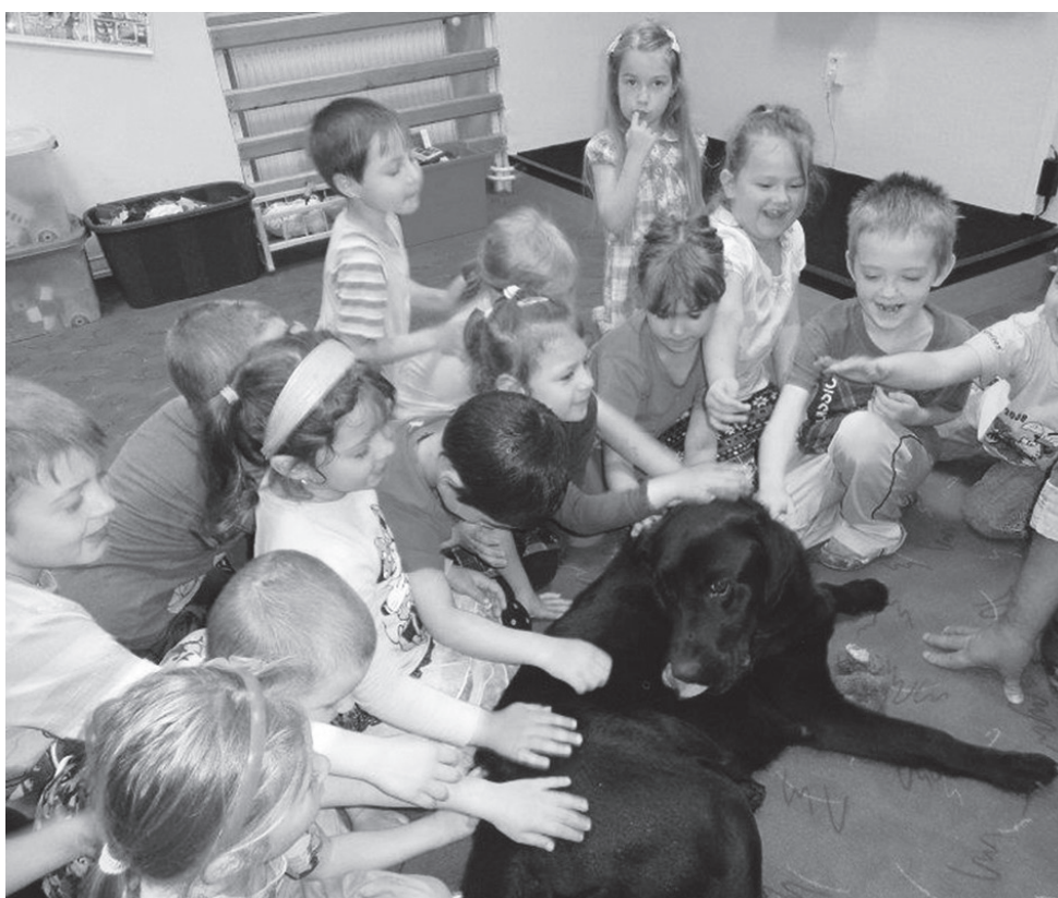
Beseda s policií