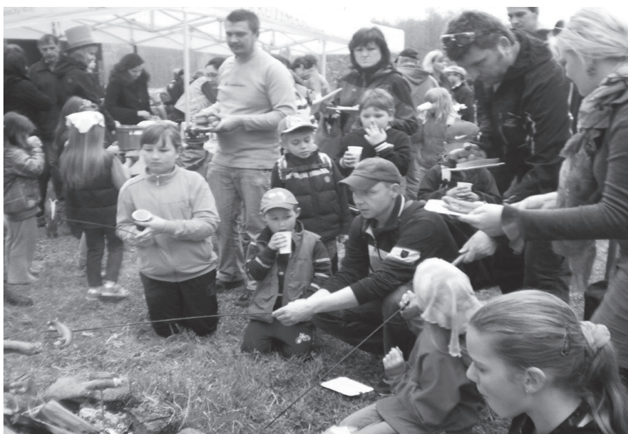
Výlet do Brniště