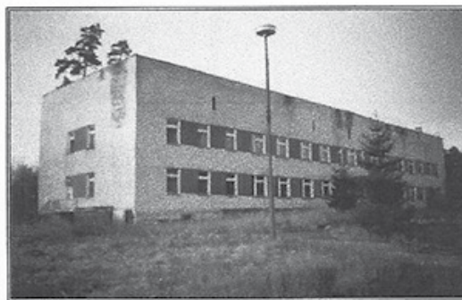
Budova, 2NP, před rekonstrukcí Zastavěná plocha 668 m 2 , cena k jednání: 150 000,-Kč