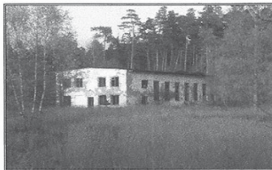
Výrobně - skladovací hala Zastavěná plocha 379m 2 , cena k jednání: 450 000,-Kč

Bližší informace: Ing. Vátrt Marian, tel. 607512280, mail: marian.vatrt@seznam.cz nebo na http://ralsko-vivo.webnode.cz/ nebo http://www.reality.cz/prodej/Ralsko/