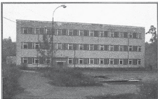
Výrobně-skladovací budova, 3NP, halové prostory Zastavěná plocha 726 m 2 , cena k jednání: 1.900.000,-Kč,