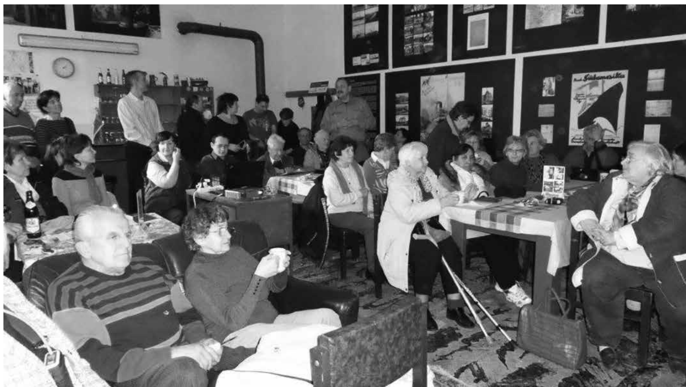
Muzeum vystěhoavectví do Brazílie - Náhlov