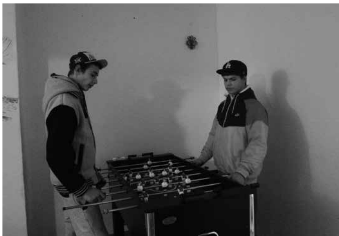
Turnaj ve fotbálku