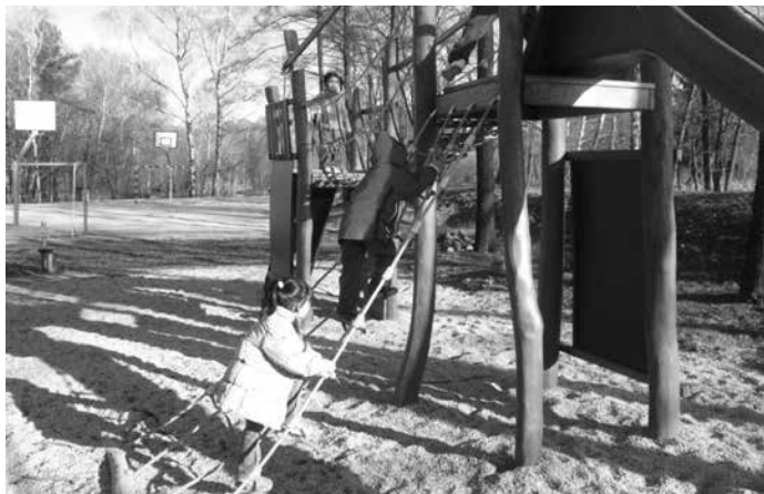
Dětské hřiště v Náhlově nezahálí