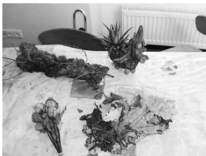
Práce dětí z výtvarného kroužku