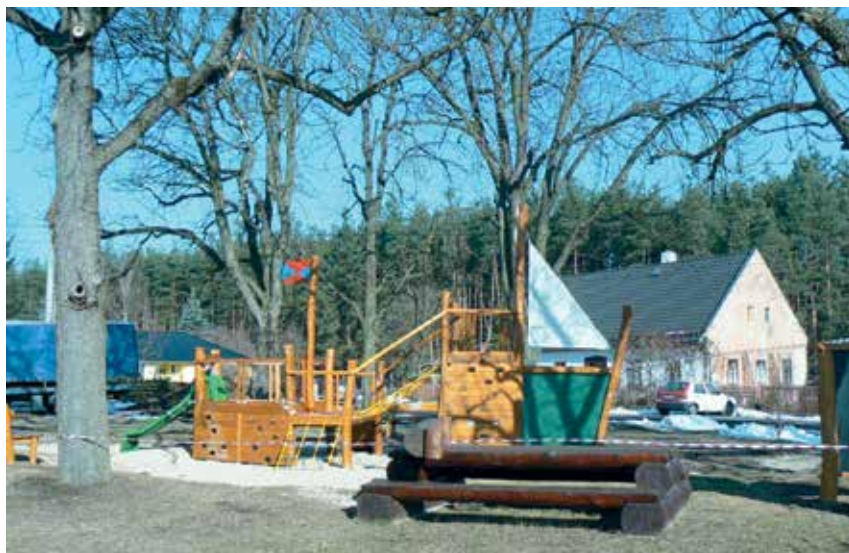
Dětské hřiště v Hradčanech