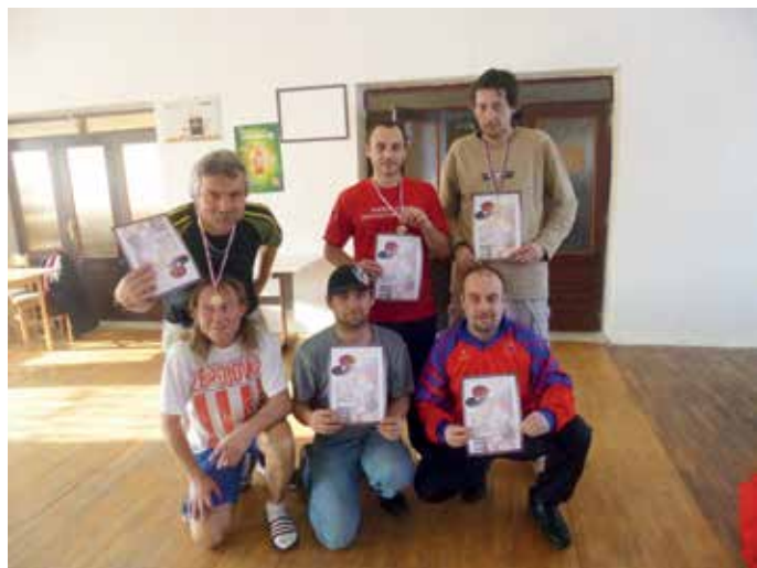
Vítězové ve stolním tenise