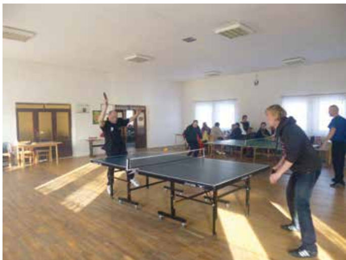
Utkání ve stolním tenise