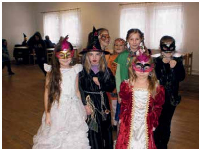
Dětský maškarní karneval

1. března Místní centrum zorganizovalo v Motorestu v Kuřívodech dětský maškarní karneval. K vidění byly různé masky: princezny, čarodějnice, čarodějové, lišky... Za doprovodu hudby děti soutěžily. Za každý splněný úkol čekala na soutěžícího sladká odměna, nebo si odnesl postavičku vytvořenou z obrázku. Pro nejhezčí tři masky byla připravena sladká odměna v podobě čokoládové figurky. Přestože nebyla účast velká, děti si to odpoledne užily.