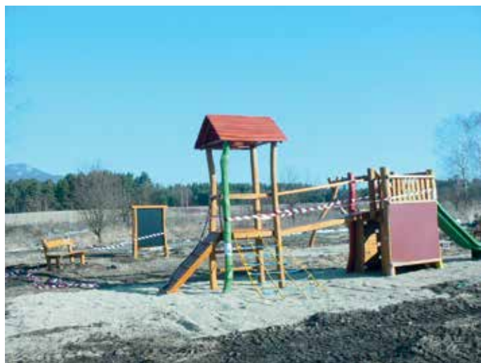
Dětské hřiště Hvězdov

zhotovení dětských hřišť v lokalitách Hvězdov, Hradčany a v Náhlově s tím, že na každou lokalitu bude vyčleněna 1/3 z celkové uvolněné částky. Rozvoj města, jako pověřený úsek k dalším úkonům při realizaci dětských hřišť, vyhlásil výběrové řízení na zhotovení jednotlivých hřišť v daných lokalitách. Následně po vyhodnocení výběrového řízení Rada města Ralsko vybrala na zhotovení dětských hřišť firmu TR ANTOŠ, s. r. o., Na Perchtě 1631, 511 01 Turnov, IČO: 48152587.