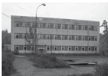
VÝROBNĚ-SKLADOVACÍ BUDOVA, 3NP Zastavěná plocha 726 m 2 , č.p. 118, CENA: 1.900.000,-Kč

Ralsko Vivo s.r.o. nabízí ze svého majetku k prodeji nebo pronájmu samostatné objekty v průmyslovém areálu Ralsko - Kuřívody.