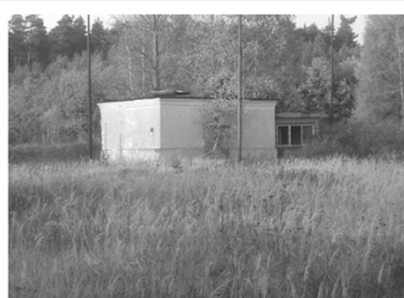
VODÁRNA – HLUBINNÝ VRT Zastavěná plocha 44 m 2 , č.p. 122, prodej jen společně s objekty č.p. 118 nebo č.p. 121 CENA: 100.000,-Kč

Ceny k jednání, v případě koupě všech objektů se souhrnná cena snižuje o 20%. Velkou část okolní plochy tvoří živé a panelové zpevněné plochy. Možnost napojení na sítě v dosahu 200-300 m. Dle územního plánu leží areál v průmyslové zóně a v mimozáplavovém území. Výborná dopravní dostupnost.