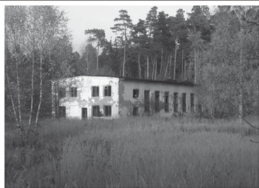
VÝROBNĚ - SKLADOVACÍ BUDOVA Zastavěná plocha 379m 2 , č.p. 123, Pronájem (ev. prodej s ostatními stavbami) CENA: 450.000,-Kč