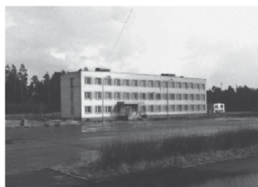
VÝROBNĚ-SKLADOVACÍ BUDOVA, 3NP Zastavěná plocha 626 m 2 , č.p. 121, CENA: 1.400.000,-Kč